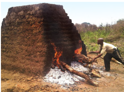
Four de cuisson pour briques de notre école

Le chapitre 5 présente des merveilles naturelles fascinantes et de véritables miracles vé- cus de pre- mière main par l'auteur et sa famille,