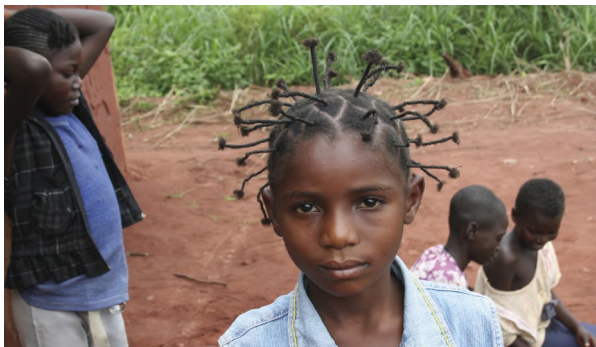
Fille avec une coiffure particulièrement jolie

Le chapitre 4 ouvre une nouvelle perspective sur la vie. Le côté spirituel de la vie est abordé, la sphère dans laquelle se trouvent l'amour et la foi véritables - deux clés importantes pour résoudre les problèmes à la fois globaux et personnels.