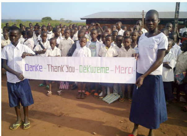
Signe de gratitude pour l'enseignement scolaire gratuit

Le chapitre 6 donne un aperçu du plus grand mi- racle de tous : l'amour véritable - avec des exemples qui offrent des encouragements et de l'espoir. Différentes propriétés de cette vertu sont représentées et, à la fin, l'auteur explique com- ment, selon lui, on peut recevoir la forme la plus haute d'amour.